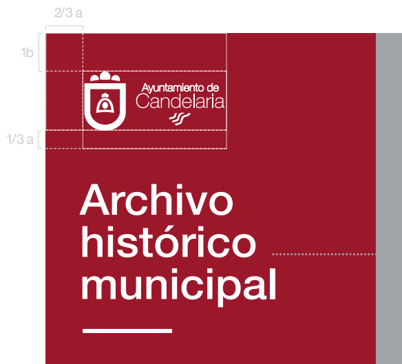
Modelo de rotulación de Espacios de Interés. 15% del tamaño original

Horario: Lunes a viernes. 16.00 a 20.00 h. bibliomalpais@candelaria.es www.candelaria.es